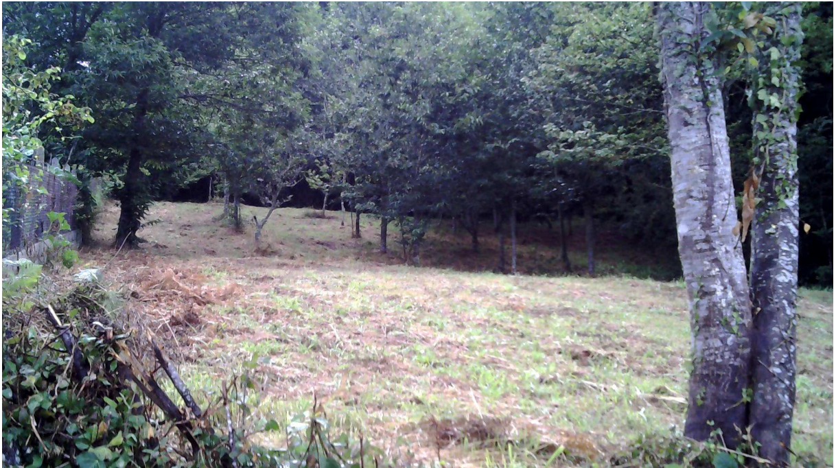
6. Pasto arbolado (PA) entre 40 - 60 cm: