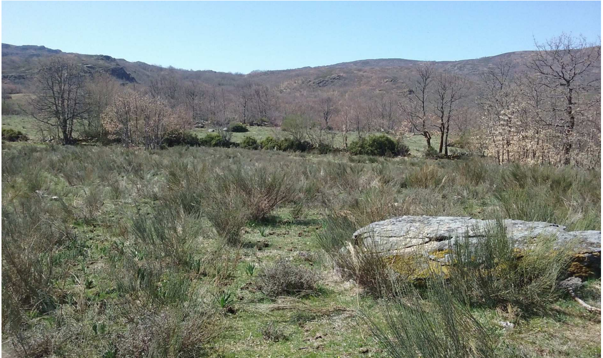
4. Pasto arbustivo (PR) maior de 60 cm: