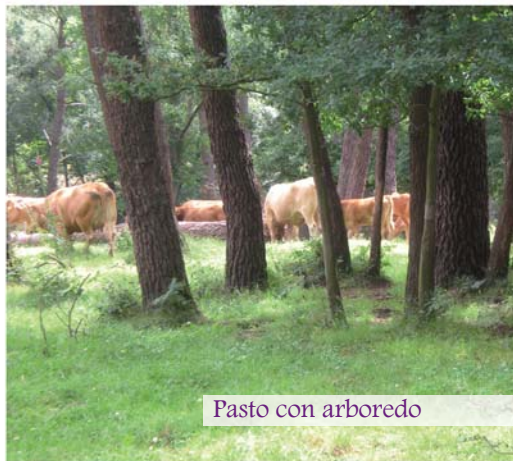
Pasto con arboredo

Pasto procedente de especies leñosas de escasa altura (árbores de porte achaparrado e verdadeiros arbustos) que en xeral é aproveitado por pastoreo. Inclúe vexetación natural herbácea e arbustiva e cultivo de arbustos forraxeiros.