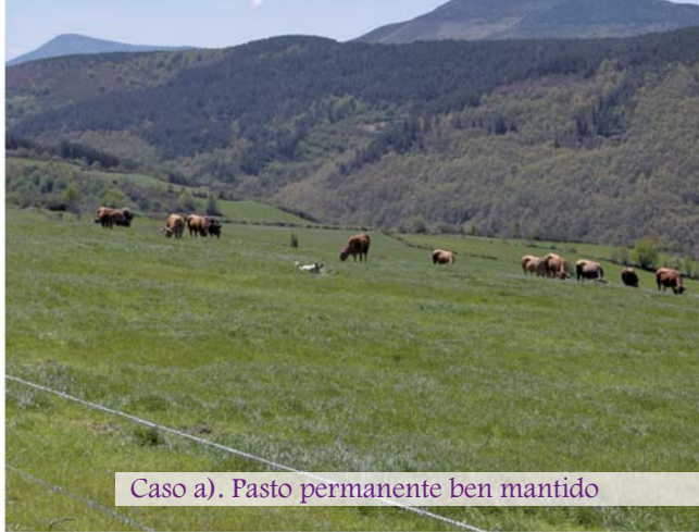
Caso a). Pasto permanente ben mantido

Nos casos b) e c) os incumprimentos darán lugar a unha diminución das axudas.