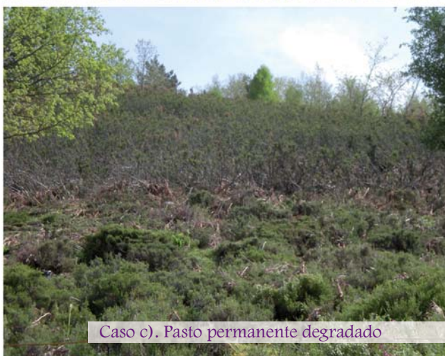
Caso c). Pasto permanente degradado