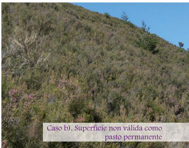
Caso b). Superficie non válida como pasto permanente